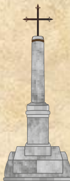
Cruz del Siglo. San Pablo de los Montes. (Subida a la Fuente Santa).