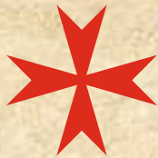
Cruz de la Orden del Temple.

El territorio que ocupa hoy el termino municipal de San Pablo de los Montes, en la Edad Media, estaba dividido jurisdiccionalmente por la cuerda de la sierra y puertos. La zona norte protegida por la encomienda de Montalban (Caballeros Templarios) y la zona sur por la Orden de Calatrava.