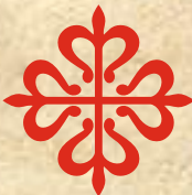
Cruz de la Orden de Calatrava.